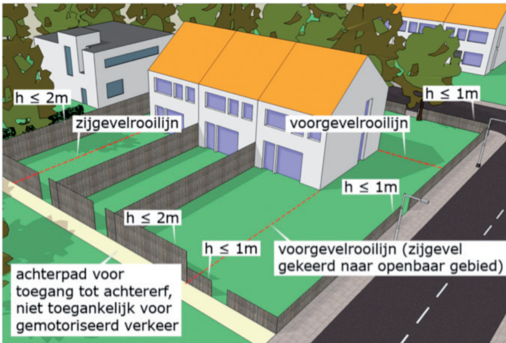
De tekening laat zien in welke gevallen een erfafscheiding zonder omgevingsvergunning mag worden geplaatst

Voor de voorkant (vóór de voorgevelrooilijn) gelden aparte maatstaven. De afscheiding mag tot 1 meter hoogte zonder omgevingsvergunning worden geplaatst. Wilt u vóór de voorgevelrooilijn een afscheiding plaatsen die hoger is dan 1 meter, dan moet u hiervoor een omgevingsvergunning aanvragen. Bij een hoekwoning wordt ook de zijgevel die gericht is naar het openbaar gebied gezien als voorgevelrooilijn.